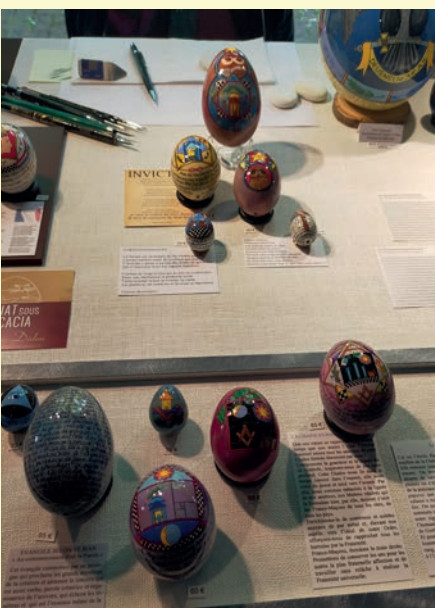
Objets d'artisanat présentés par « Le chat sous l'Acacia »