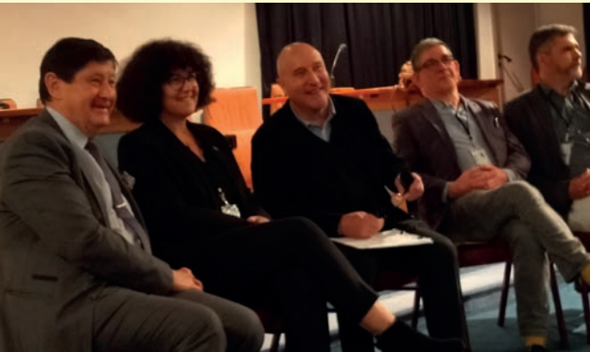
« La Franc-maçonnerie dans la société »

« La Franc-maçonnerie dans la société » « La mixité en Franc-maçonnerie » ; « Qui peut devenir Franc-maçon ? » ; « Franc-maçonnerie entre tradition et modernité » ; « Rites et symboles pour quoi faire ? » ; « Franc-maçonnerie société secrète ? » et « L'aventure du livre et de l'imprimerie au siècle de l'humanisme »