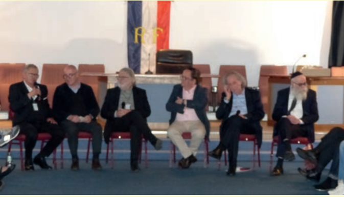
Conférence – débat « Franc-maçonnerie et religions »